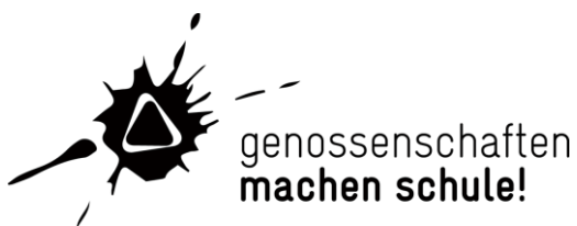
Bildmaterial: Logo Genossenschaften machen Schule

Die Unterrichtsplattform wird in Zusammenarbeit mit dem Bildungspartner HEP-Verlag auf das Schuljahr 2017/2018 hin lanciert.